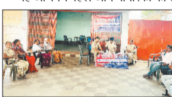
यहां अभिनव पहल आम नागरिकों को त्वरित, सुलभ एवं प्रभावी पुलिस सेवा प्रदान करने के उद्देश्य से की गई, जिसके अंतर्गत पुलिस टीमों का आमजन के बीच पहुंचा। आयोजन स्थल पर अस्थायी

कोरबा। पुलिस अधीक्षक के निर्देशन एवं अतिरिक्त पुलिस अधीक्षक तथा नगर पुलिस अधीक्षक के मार्गदर्शन में मानिकपुर चौकी क्षेत्र अंतर्गत दादर में चलित थाना का आयोजन किया गया।