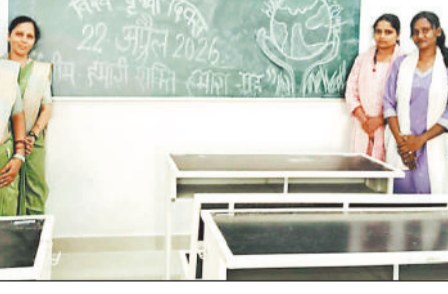
कार्यक्रम में उपस्थित शिक्षक एवं छात्र-छात्राएं।