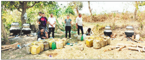
मौके पर जली की कार्रवाई करती पुलिस टीम।