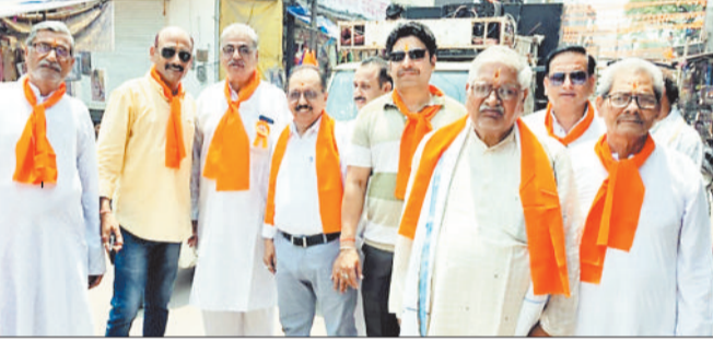
भगवान परशुराम की शोभायात्रा में शामिल विप्रगण।

स्थानीय मारवाड़ी ब्राह्मण सेवा संघ तथा परशुराम ब्राह्मण युवा संगठन द्वारा विप्र कुलभूषण एवं समाज के आरंध्य देव भगवान परशुराम जी की जयंती विगत 19 एवं 20 अप्रैल को धूमधाम से परम्पराानुसार मनाई गई। इस मौके पर दोनों ही समाज द्वारा भगवान