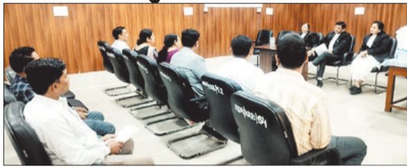
लोक अदालत को सफल बनाने पर चर्चा करते पैनल के पदाधिकारी।