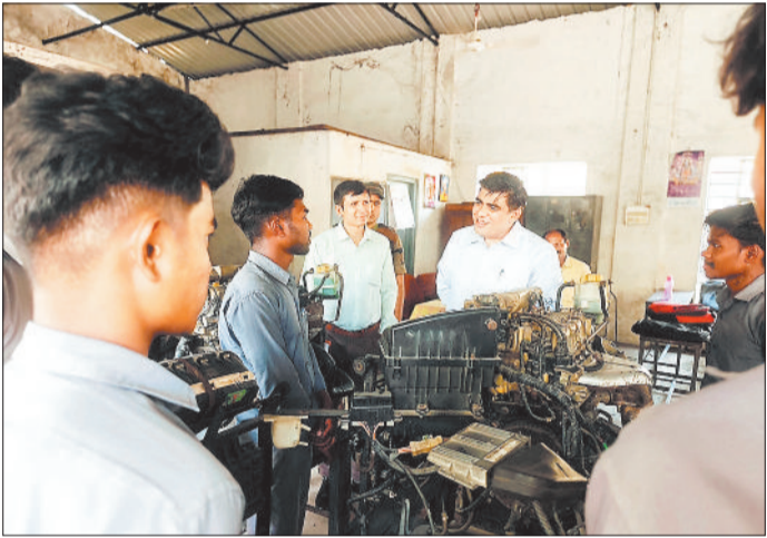
निरीक्षण के दौरान आईटीआई प्रशिक्षुओं से चर्चा करते कलेक्टर दुदावत व अन्य।

निरीक्षण की शुरुआत लाइब्रेरी से हुई, जहां पुस्तकों की अत्यंत अव्यवस्थित स्थिति, पुरानी सामग्री की अनावश्यक ढेर और स्टॉक के अभावपूर्ण संधारण पर कलेक्टर ने गंभीर अंतर्तोष व्यक्त किया। उन्होंने निर्देश दिया कि लाइब्रेरी को तत्काल सुव्यवस्थित किया जाए तथा अनुपयोगी सामग्री को शासन के नियमों के अनुसार स्कैप में निस्तारित किया जाए। इसी क्रम में कर्मचारियों और प्रशिक्षुओं की उपस्थिति रजिस्टर तथा अन्य प्रशासनिक अभिलेखों के संधारण में भी अनियमितता पाई गई। प्राचार्य द्वारा उपस्थिति संबंधी विस्तृत