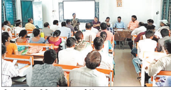
प्रशिक्षण में शिक्षक-शिक्षिकाओं को जानकारी देते मास्टर ट्रेनर।